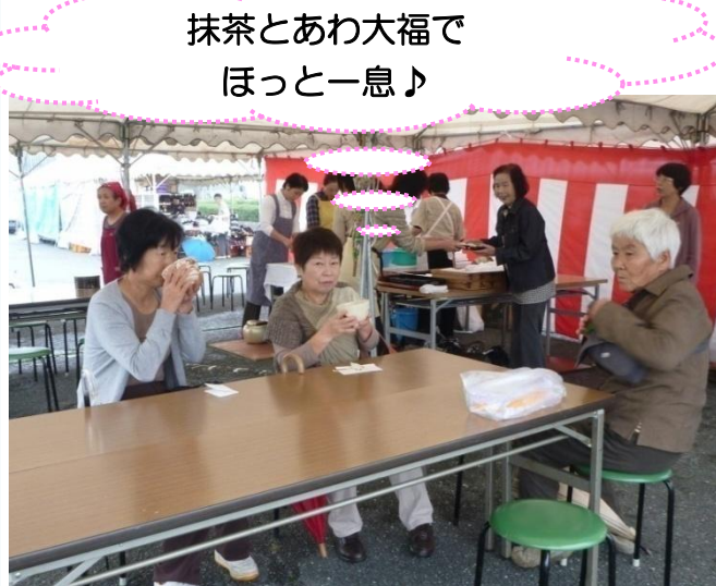
抹茶とあわ大福で ほっと一息♪

来場者は「あわ大福の甘さと抹茶の苦さが合っていて、とてもおいしかったです」と笑顔で話していました。