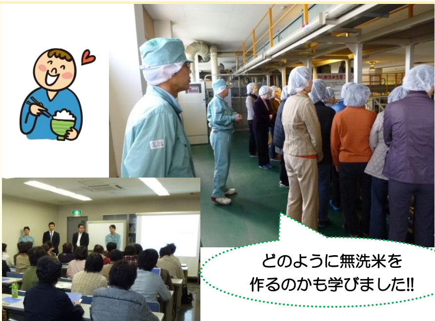
どのように無洗米を作るのかも学びました!!

参加者は「お米が全国から集まっているのに驚きました。各家庭に届くまでに厳重な選別がおこなわれているので、生産者も消費者も安心ですね」と話していました。