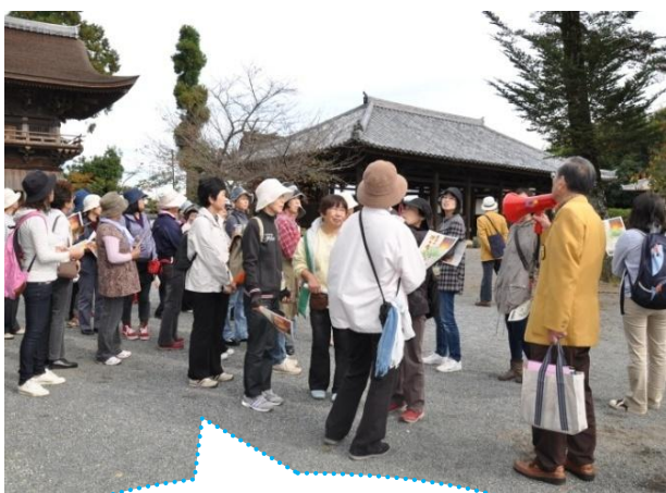
地域の良さを 再発見できました!!

受講生は「地元には国宝があるのを知っていたが、堂内は拝観したことがなかったので、ボランティアガイドさんの丁寧な説明を聞きながらウォーキングできてよかったです」と話していました。