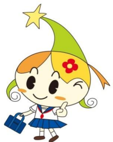
JA兵庫みらい みらいちゃん